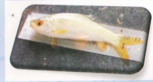
संचयन योग्य मत्स्य बिज