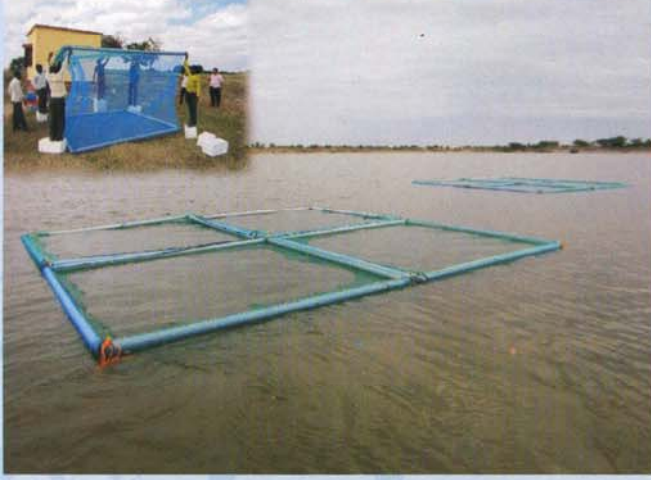
पिंजरा मत्स्य संवर्धन पध्दत