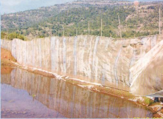
कुपण मत्स्य संवर्धन पध्दत